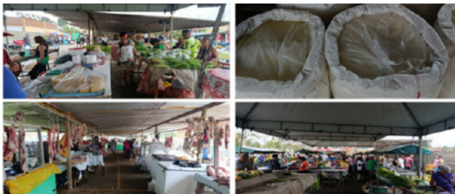
Figura 5 - Atual dinâmica de abastecimento alimentar da feira livre em Itajuípe.

sábados. Sua trajetória traduz a força da economia popular e a importância das feiras como espaço de autonomia, convivência e trabalho digno.