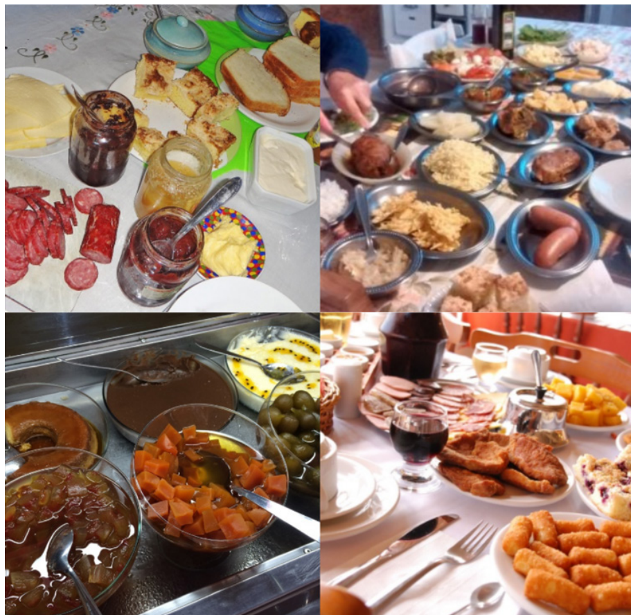
Figura 1 – Café da manhã, almoço, sobremesas e café da tarde típicos do Kerb (cucas, embutidos, compotas, doces coloniais e pratos de influência germânica).