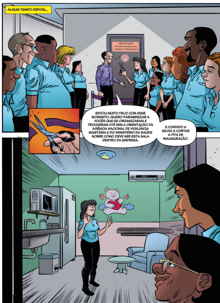
Figura 3 - Inauguração da Sala de Apoio à Amamentação para a Mulher Trabalhadora