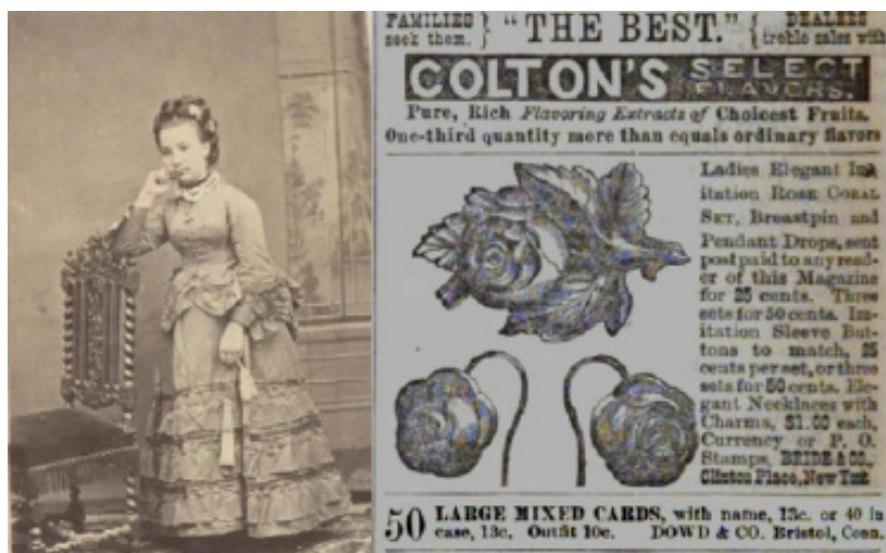
Figura 3 - À esquerda, moça com penteado com aplicações no cabelo, década de 1870. À direita, anúncio de flores para cabelo, de dezembro de 1877.