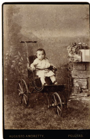
Figura 1 - Criança de vestido com calça por baixo, 1860 a 1880.

Neste sentido, a revista A Estação 12 , na edição publicada em 15 de junho de 1879, recomendava que o vestuário de recém-nascidos deveria seguir “os conselhos dos higienistas”. Com modelos longos e largos, os vestidos, roupões e camisolas deveriam ser confeccionados com tecidos apropriados para a estação: o outono e no inverno, com mangas compridas e bustos fechados 13 , “[...] e no verão ao contrário, vestidinhos decotados e de mangas curtas 14 ”, como na fotografia abaixo.