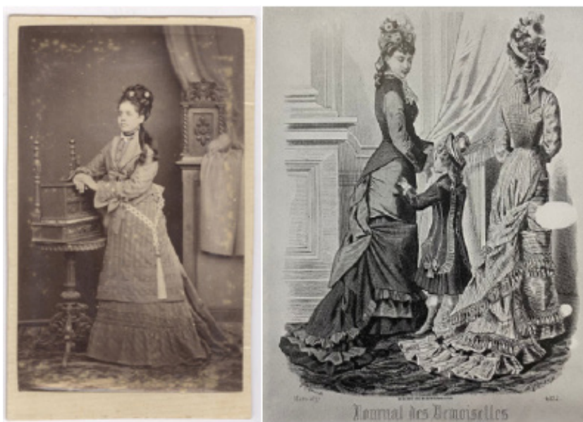
Figura 4 - À esquerda, mulher com duas peças (1860 a 1880), e à direita, duas mulheres e uma criança expondo detalhes do vestuário da época.