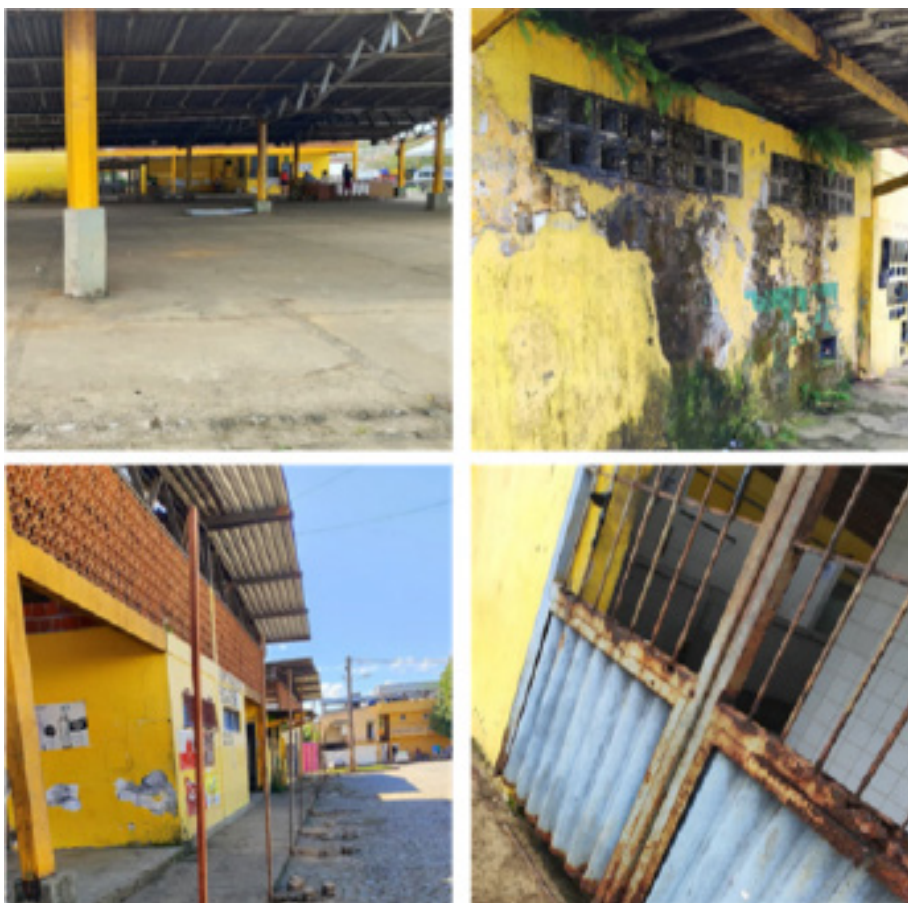
Figura 01 – Centro de Abastecimento/”Mercadão” antes da reforma.

O projeto do novo mercado prevê melhorias na acessibilidade, organização por seções, áreas cobertas, câmaras frias e espaços de armazenamento adequados. Durante as entrevistas, os feirantes destacaram que os valores cobrados em taxas referentes à ocupação de espaço, limpeza e energia são recolhidos diretamente pela Prefeitura, e parte dos recursos é destinada à manutenção e limpeza do local. Contudo, ainda não há prestação de contas pública e regular sobre o destino total dessas arrecadações, apontando um campo a ser aprimorado em termos de transparência e gestão.