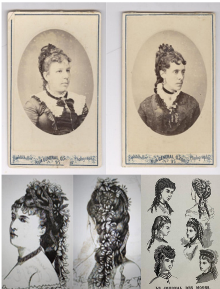
Figura 5 - Acima, retratos de mulheres (Batista Lhullier, 1876 a 1878). Abaixo, penteados usados pelas mulheres na Europa, década de 1870.

Fonte: Acervo da Fototeca. Abaixo, à esquerda, Peterson's Magazine 35 . À direita, Laver, 1989, p. 191.