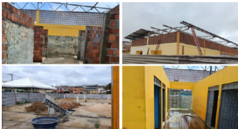
Figura 02 – Centro de Abastecimento/”Mercadão” em reforma.