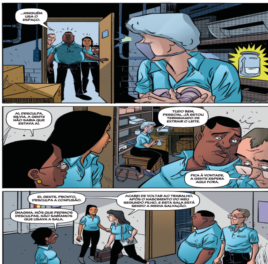
Figura 2: A personagem Silvia é surpreendida pelos colegas enquanto extrai seu leite

Na edição em questão, a dificuldade enfrentada personagem Silvia diz respeito a ausência de um espaço apropriado para coletar e armazenar seu leite, durante sua jornada de trabalho conforme ilustrado nos trechos que seguem: