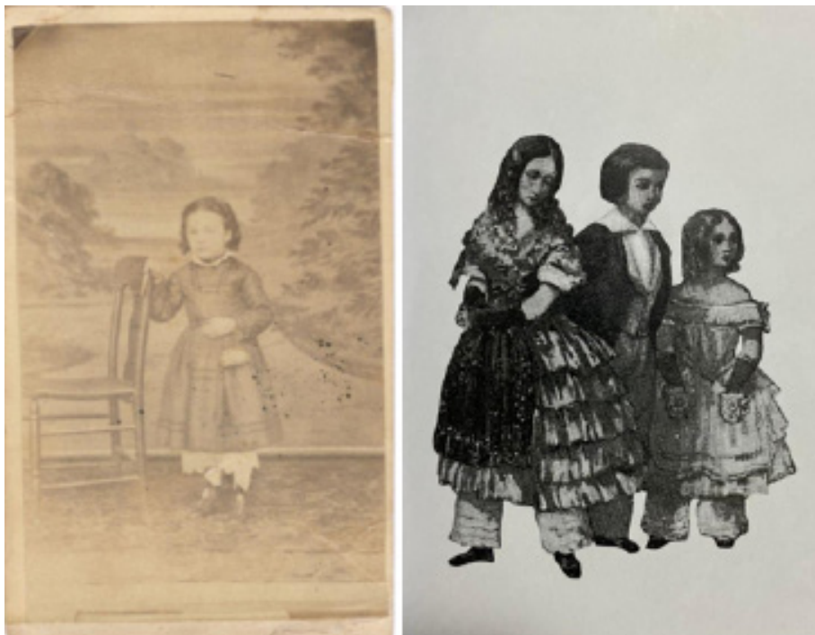
Figura 2 - À esquerda, menina de vestido com calça por baixo (1860 a 1880). À direita, meninas com calças por baixo dos vestidos, 1853.